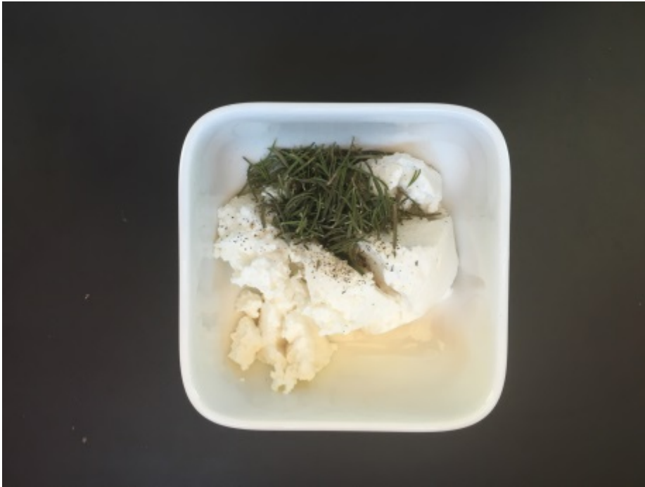
Un fromage blanc à aromatiser

On le sale, on le poivre et on le mélange avec les herbes romarin ou persil bio.