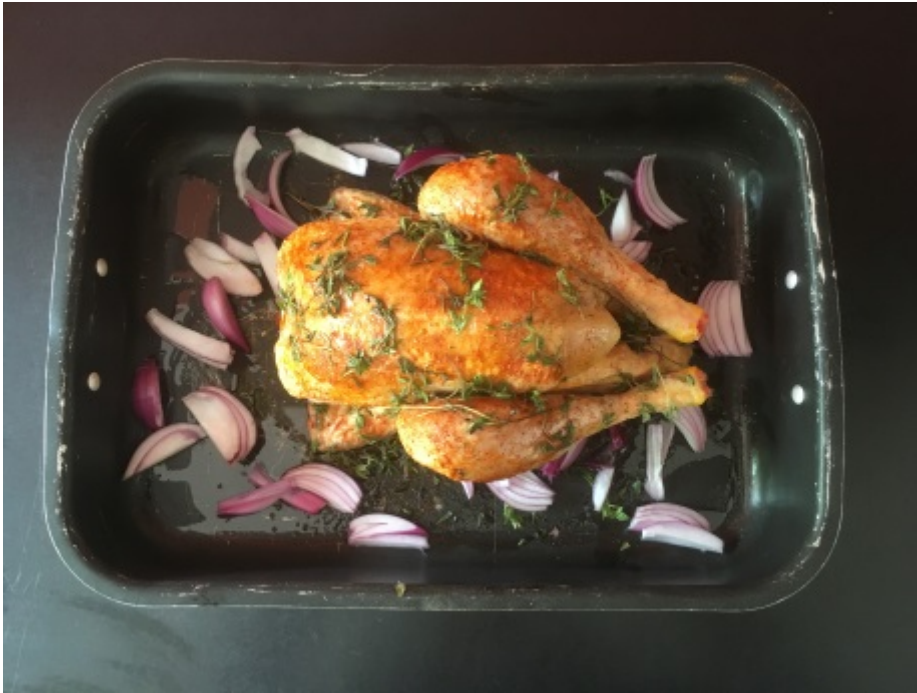
Préparation du poulet bio

On s'occupe du poulet bio, en l'enduisant méticuleusement de paprika, sel, poivre, thym bio, et en l'arrosant d'huile d'olive, et en le parsemant généreusement de thym. On découpe en lamelles l'oignon et on les ajoute au plat.