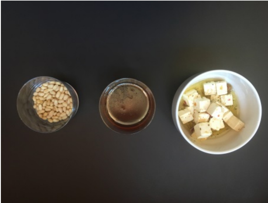
Un assaisonnement relevé

On mélange comme pour une vinaigrette classique, l'huile, le vinaigre, le sel et le poivre. On ajuste en fonction du niveau d'acidité souhaitée.