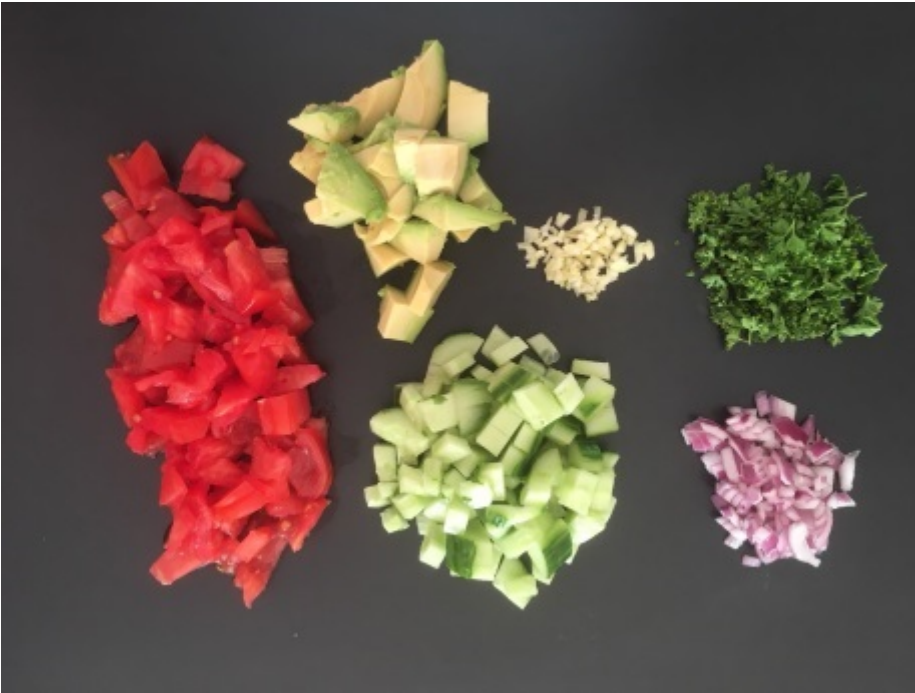
La découpe des légumes bio...

...c'est 80% du travail de fait, pour vous dire comme c'est simple.